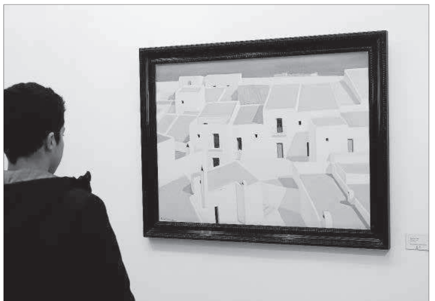
L'exposició amb motiu del centenari del naixement del pintor es pot veure fins a final de mes a Maó.

La mostra es va inaugurar ahir capvespre a la sala maonesa, on es podran veure les obres de Ferrer Guasp fins al 31 de març. L'horari de visites serà de dilluns a divendres, de 17.30 a 20.30 hores.